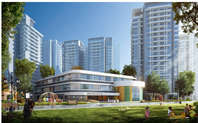
规划中的人才公寓配套齐全

本报讯 “什么？格力要建人才公寓？”12月30日，格力再度发布重磅消息，据了解，格力电器拟投资新建“人才公寓”，主要用于解决格力电器骨干员工的住房问题。这是继11月24日感恩节豪气加薪1000元之后的又一重磅福利，格力员工的心又被狠狠地暖了一把。